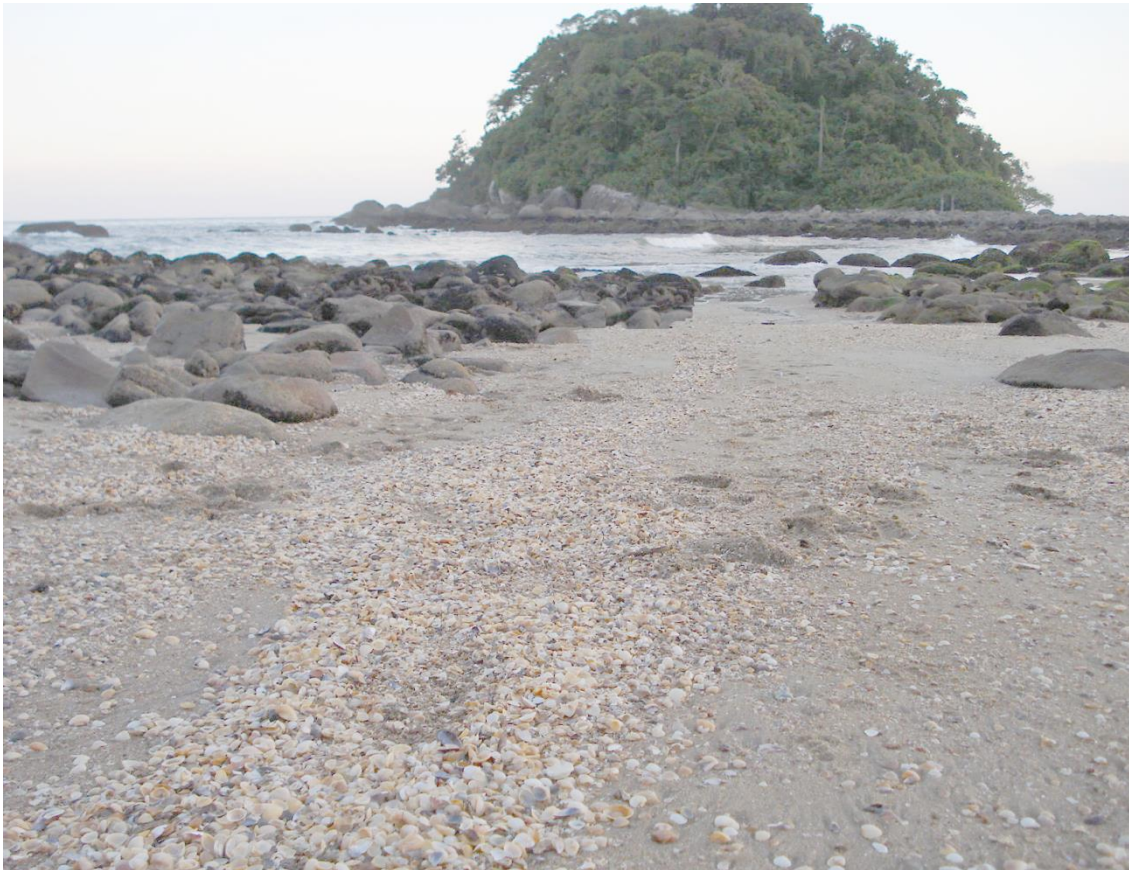
Figura 1. Depósitos de sedimentos biodetríticos em frente à Ilha do Farol, Praia dos Amores, Matinhos, Paraná.

O local escolhido para a realização das coletas dos dentes fossilizados foi no banco de cascalhos que se espalha por uma área de 50 m 2 , em frente à Ilha do Farol (25°51'07" S, 48°32'09" W) ( Figura 1 ), também conhecida como Ilha da Tartaruga, localizado na Praia dos Amores, município de Matinhos, Estado do Paraná.