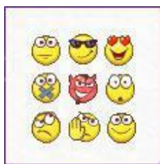
Fig. 8. Smirks denoting textual emotions

C The loss of literacy to the point of inability to string a word or two together and the transformation of people into a mooing herd has led to a trend for expressing what appear to be opinions through grimaces or smirks, called emojis, supposedly 'animating' primitive computer text through undefined emotions indicating mood. A reversal of the transition to hieroglyphics, invented to stun the text under the guise of deep thought. Similar manifestations of 'coolness' include such expressions as многобукафф, леньчитать, анижедети, какбы, кароче, афтаржжот .