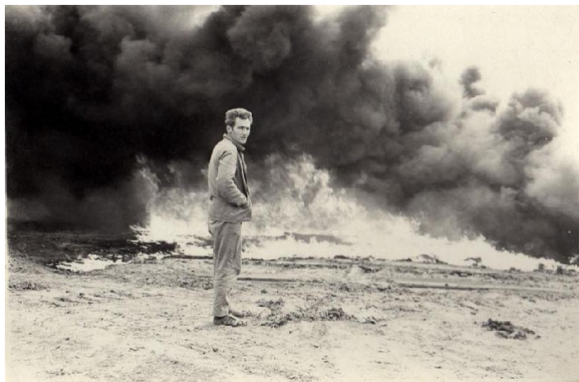
Fig.2. Burning steppe

The highlighted words indicate its main characteristics: what is dusty, smoky, swirling is the fog.