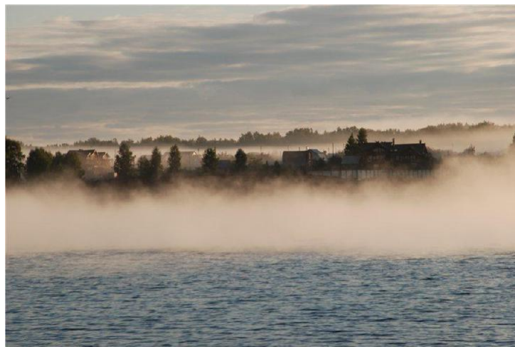
Fig. 1. The mists floated over the river

Hence the sought etymology of the Mologa itself. It is whitish, like milk . Why? The frequent mists, the very same mists that 'floated over the river'. Mologa means milky white fog. This fog is wet . And this is its Russian name.