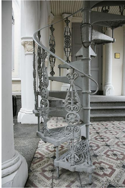
Fig. 7. Лествица is a twisted (spiral) staircase

The word лествица is also used in a philosophical sense: L'Escalier des Sages, because the mental quest is akin to wandering in a circle in the forest, as understood by these kinds of dreamers themselves with a gradual, though slow (steady) ascent upwards.