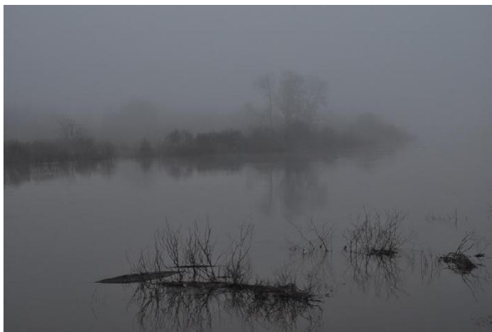
Fig.5. Twilight fog

The second fog is dark , formed by the dust and smoke of military fires and is called тьма (darkness) when visually impenetrable. Тьма can also mean the number 10,000. One cannot see a thing in it either, but it is still dark . This is the supposedly Turkic dry fog . So typical in the Horde era, it even superseded the original молога .