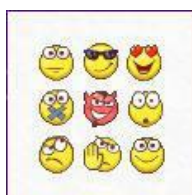
Рис. 8. Ухмылки, обозначающие текстовые эмоции.

С утратой грамотности до неспособности связать пару слов с превращением людей в мычащее стадо, явилась мода на выражение каких-то вроде-бы-мнений посредством кривляний или ухмылок, именуемых «смайликами», якобы «оживляющими» примитивный компьютерный текст посредством неопределенных эмоций, обозначающих настроение. Обратный переход к иероглифам, придуманный для оглупления текста под видом глубокомыслия. К подобным же проявлениям «крутости» относятся и выражения « многобукафф » или « леньчитать », « анижедети », « какбы », « кароче », « афтаржжот ».