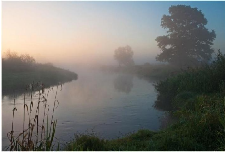
Рис.3. Предрассветный туман