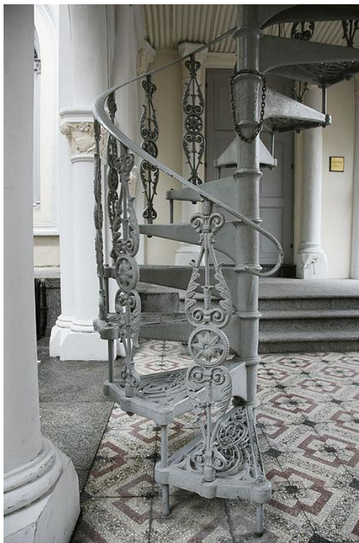
Рис. 7. Лествица – витая (винтовая) лестница.

Слово «лествица» употребляется также и в философском смысле – «Лествица мудрецов» (L'Escalier des Sages), поскольку умственные искания сродни блужданиям по кругу в лесу, в понимании самих такого рода мечтателей – с постепенным, хотя и медленным (неуклонным) подъемом вверх.