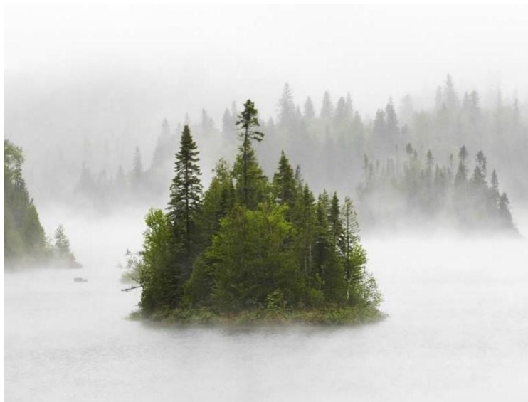
Fig. 4. A dense fog is an impenetrable haze