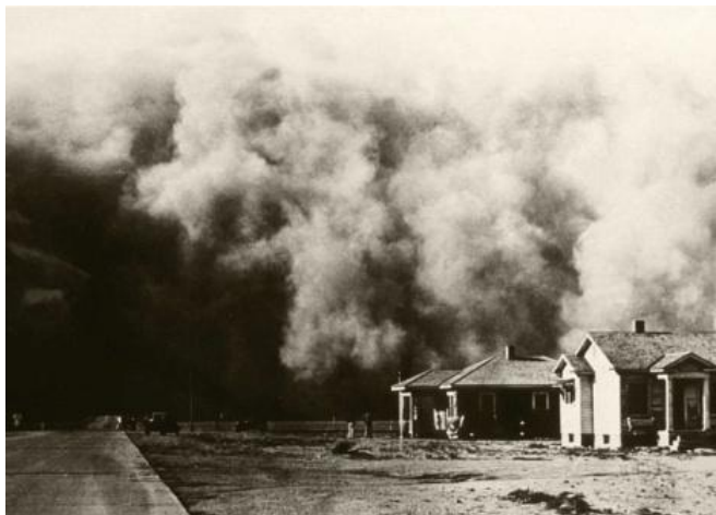
Рис.6. Пылевой туман

Второй же туман темный , образованный пылью и дымом военных пожарищ и в случае зрительной непроницаемости называется тьмой . «Тьма» может также означать число 10 000. В ней тоже может быть ни зги не видно, но при этом темно . Это и есть якобы тюркский сухой туман . Настолько характерный в эпоху Орды, что даже вытеснил собой исходную мологу .