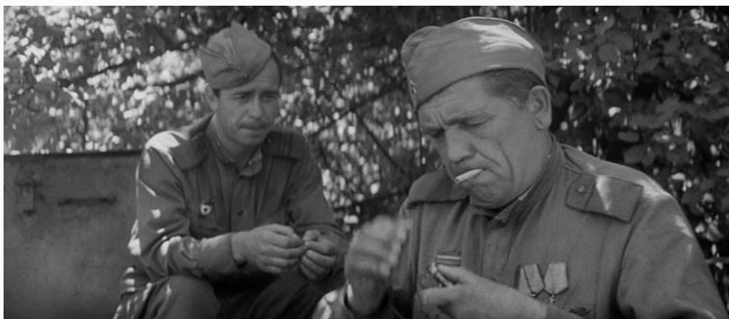
Рис. 2. Ну не мучайся ты

Я лично мог это наблюдать во время войны когда элементарно не было спичек. И приходилось высекать огонь «кресалом» в виде куска металла (стального), ударяемого о кремень для получения искр. Как в фильме «На войне как на войне».