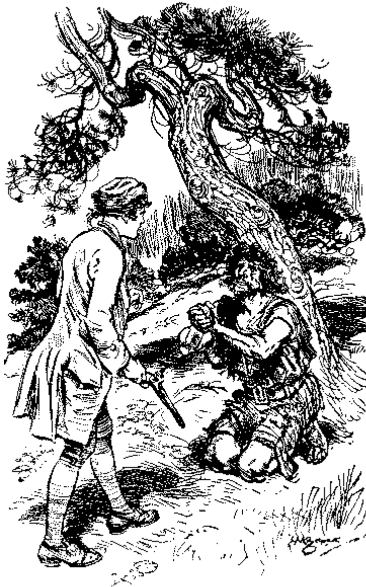
Рис. 6. Он упал на колени и с мольбой протянул ко мне руки

У Стивенсона персонаж, обнаруженный на «Острове сокровищ», носит смысловую фамилию Ган (Ben Gunn).