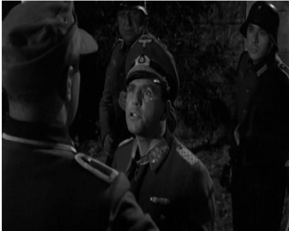
Рис. 3. Я твой любимый генерал

А как на юге может обозначаться слово «любимый»? – КОХАНЫЙ – прямо от слова КОГАН.