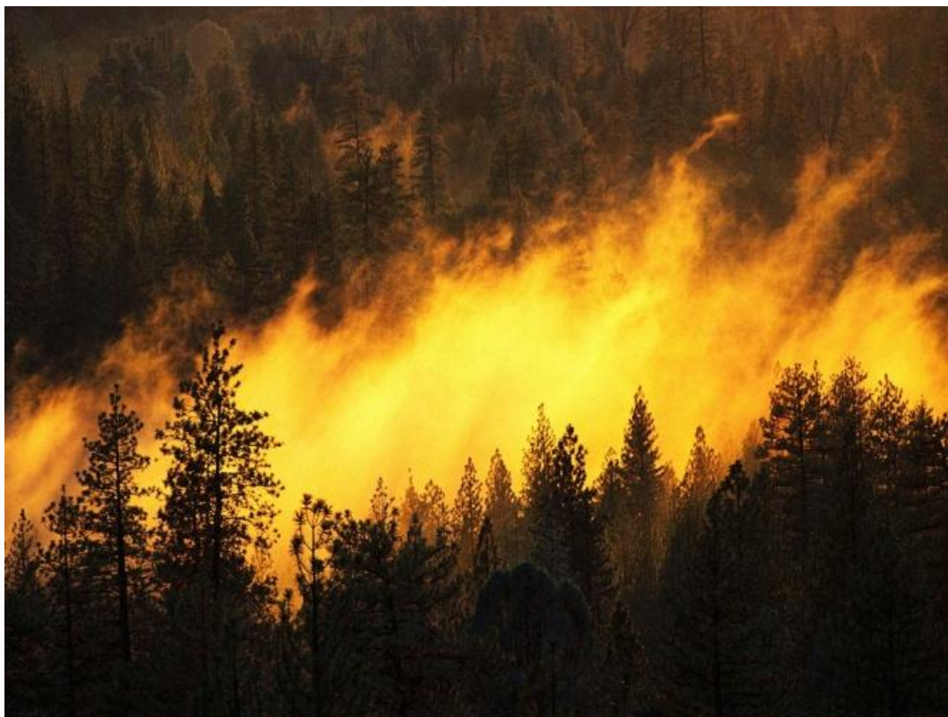
Рис. 4. Лесной пожар

Отсюда и сокращение слова ОГОНЬ в форме ГОН с небольшим изменением дающим ХАН. Это еще одна форма метафоры в виде грубой лести начальствующим и власть имеющим. ХАН ведь действительно ГОНит свое войско на войну или неприятеля прочь и ГОНится сам за добычей.