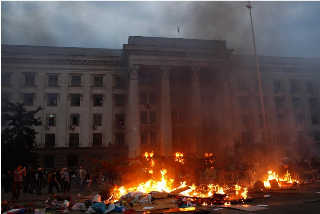
Рис. 4 «Самосожжение» в Одессе

И даже «казацкую» песню о невезучей Гале, которую отловили, увезли с собой и заживо сожгли (принеся в жертву Молоху), вероятно, все же хазары. И наконец евангельские упоминания о пожирающей тела геенне огненной, в которой слышен плач и скрежет зубов. Слово «геенна», вероятно, означает просто гуена , подобно тому как слово «верю» искусственно усложняется вариантом «верую».