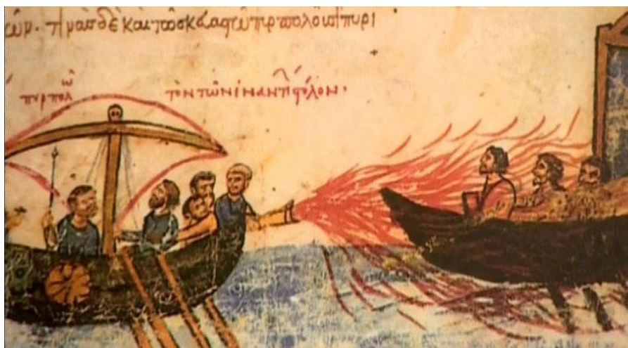
Рис. 5 «Греческий» огонь

Пушка по-английски ГАН (GUN). Вариант слова ХАН. Приведение ее в действие называется «открыть ОГОНЬ». В переводе с русского - Feuer! или Flamm! (пламя!) (нем.) или fire (англ.). Со средневековым добавлением греческий ОГОНЬ (не русский же).