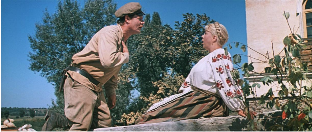
Рис. 7. Ваши трехдюймовые глазки зажгли огнедышащий пожар в моем сердце