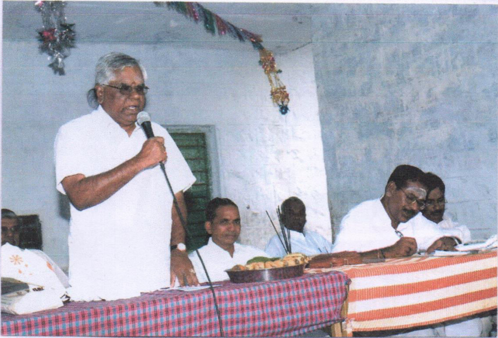
2005 ഫോൺ ക്ലബ്ബിൻ്റെ മീറ്റിംഗ്