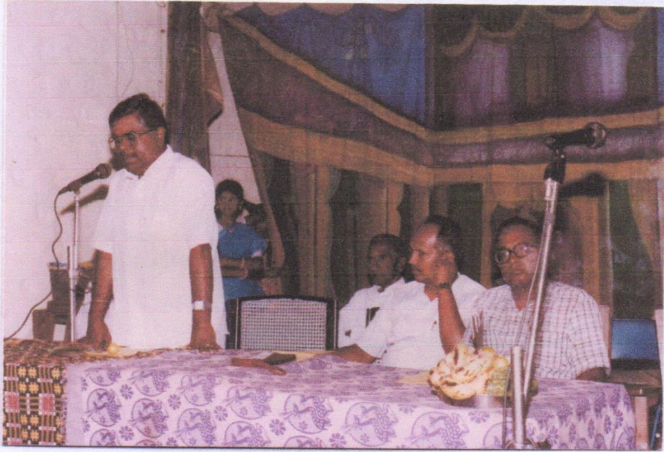
1987 - ഡിനർ ആയിരത്തി