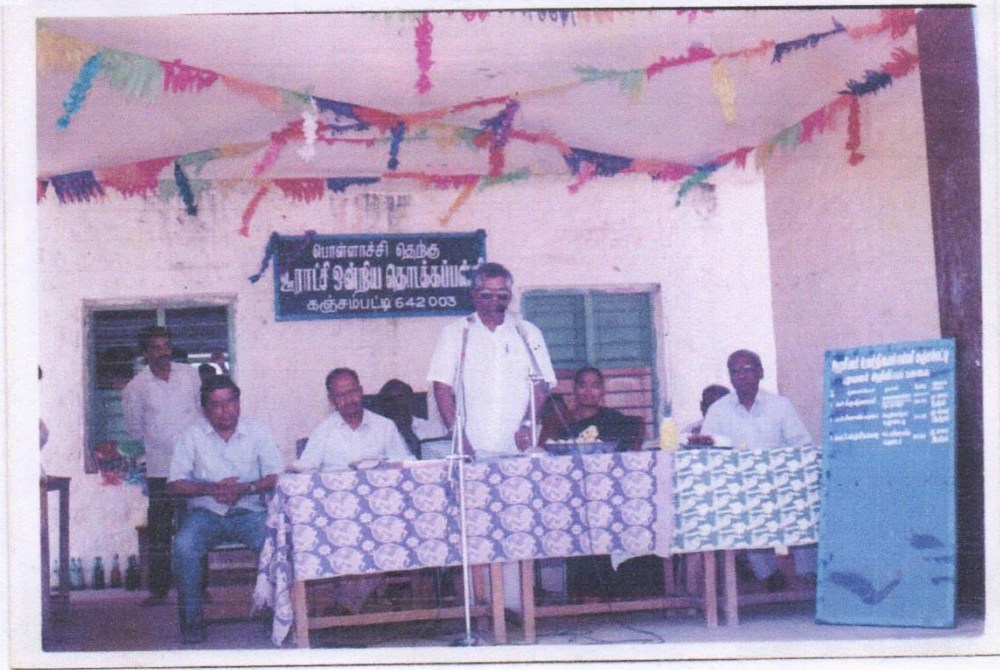
1993 . உயர்நீரைப்பள்ளி தரம் உயர்த்திய சூண்டி சந்திர தன விடு