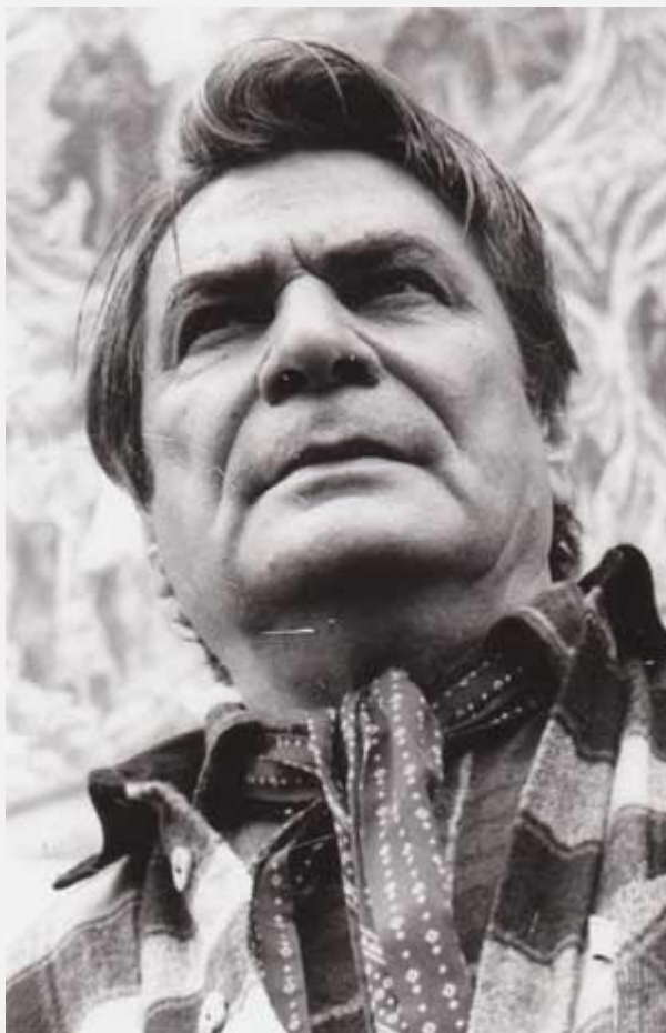
Constantin Țoiu (1923-2012)