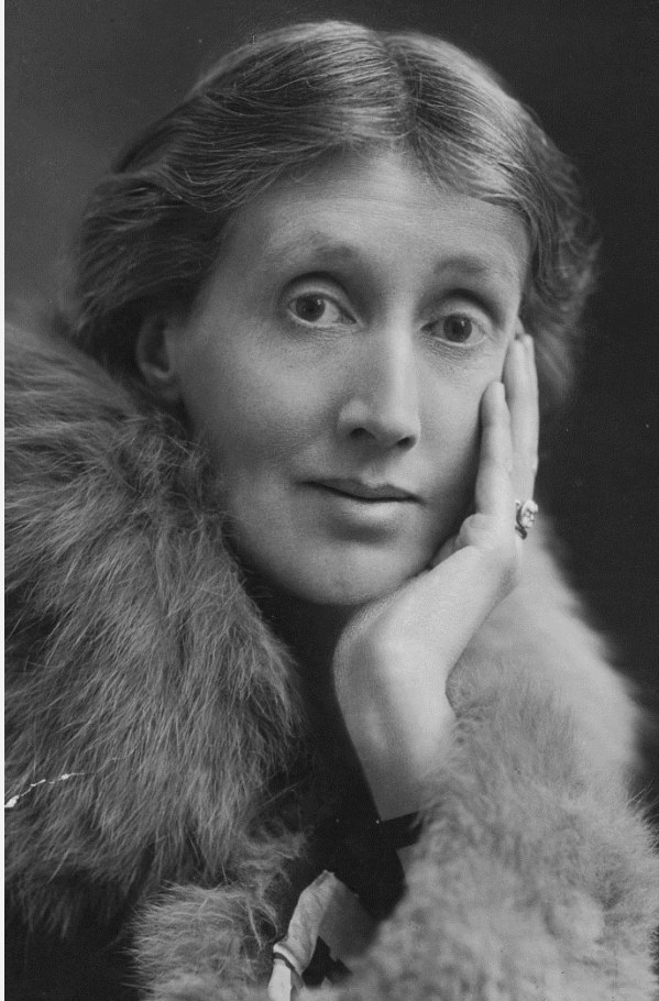
Virginia Woolf (1882-1941)