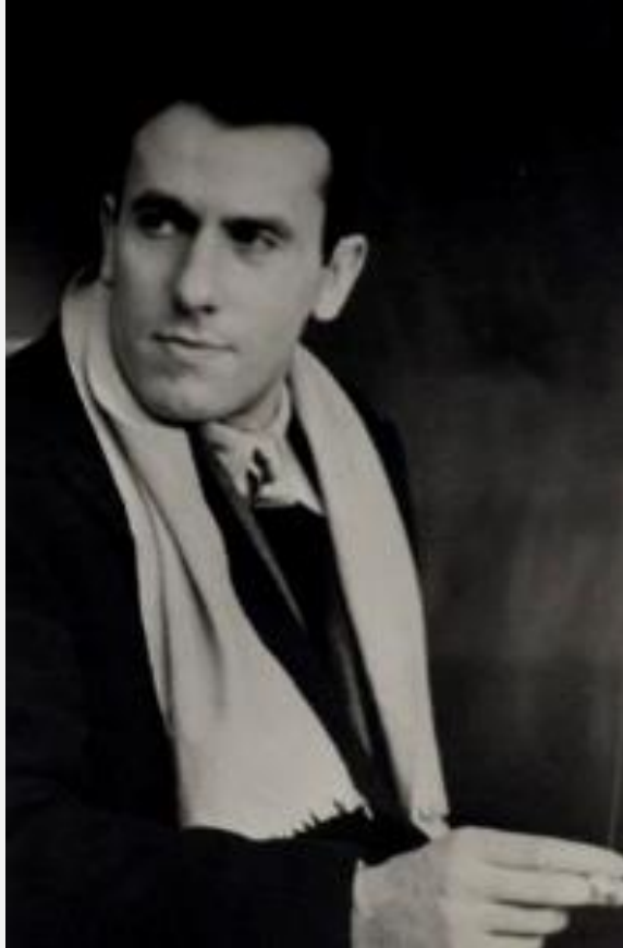
René Char (1907-1988)