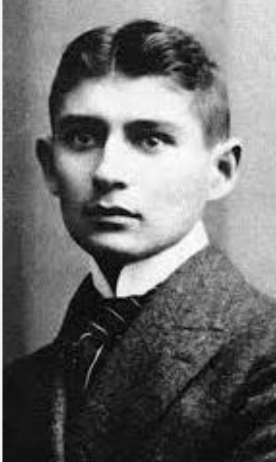
Franz Kafka (1883-1924)