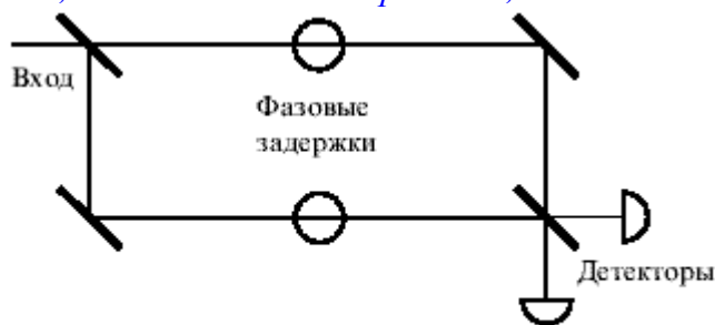
Рис. 3. Схема интерферометра Маха –Цандера.

«Рассмотрим эксперимент с интерферометром Маха-Цандера (рис.3). Подадим на него однофотонное состояние и уберем вначале второй светоделитель, расположенный перед фотодетекторами. Детекторы будут регистрировать одиночные фотоотсчеты либо в одном, либо в другом канале, и никогда оба одновременно, так как на входе – один фотон.