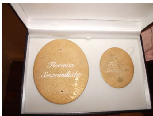
Medalia de aur, 12.06 2010, Univ. din Pécs