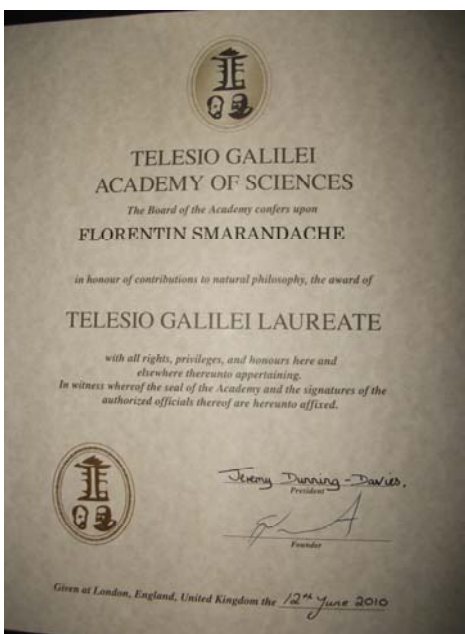
Diploma, 12 iunie 2010, Universitatea din Pécs

http://www.youtube.com/watch?v=9mydDB7zXCo&feature=related