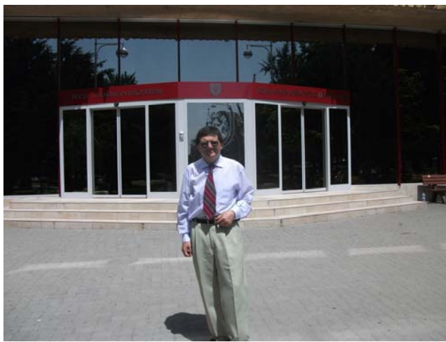
Nimeni nu-i profet în țara lui? Florentin Smarandache în fața Universității din Pécs