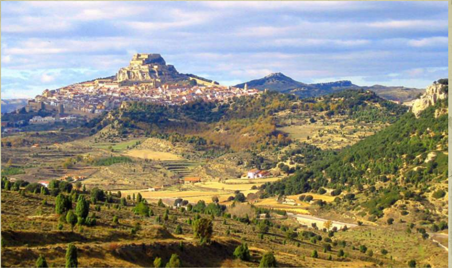
La fiesta del tiempo, Morrell, Spania