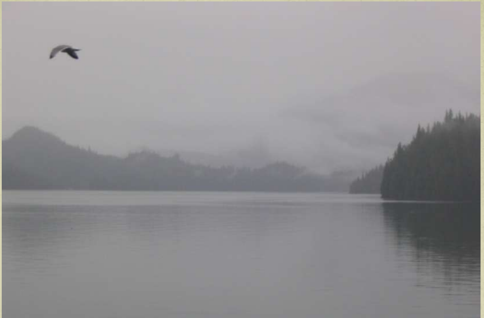
Zbor în ceață ( Alaska, USA )