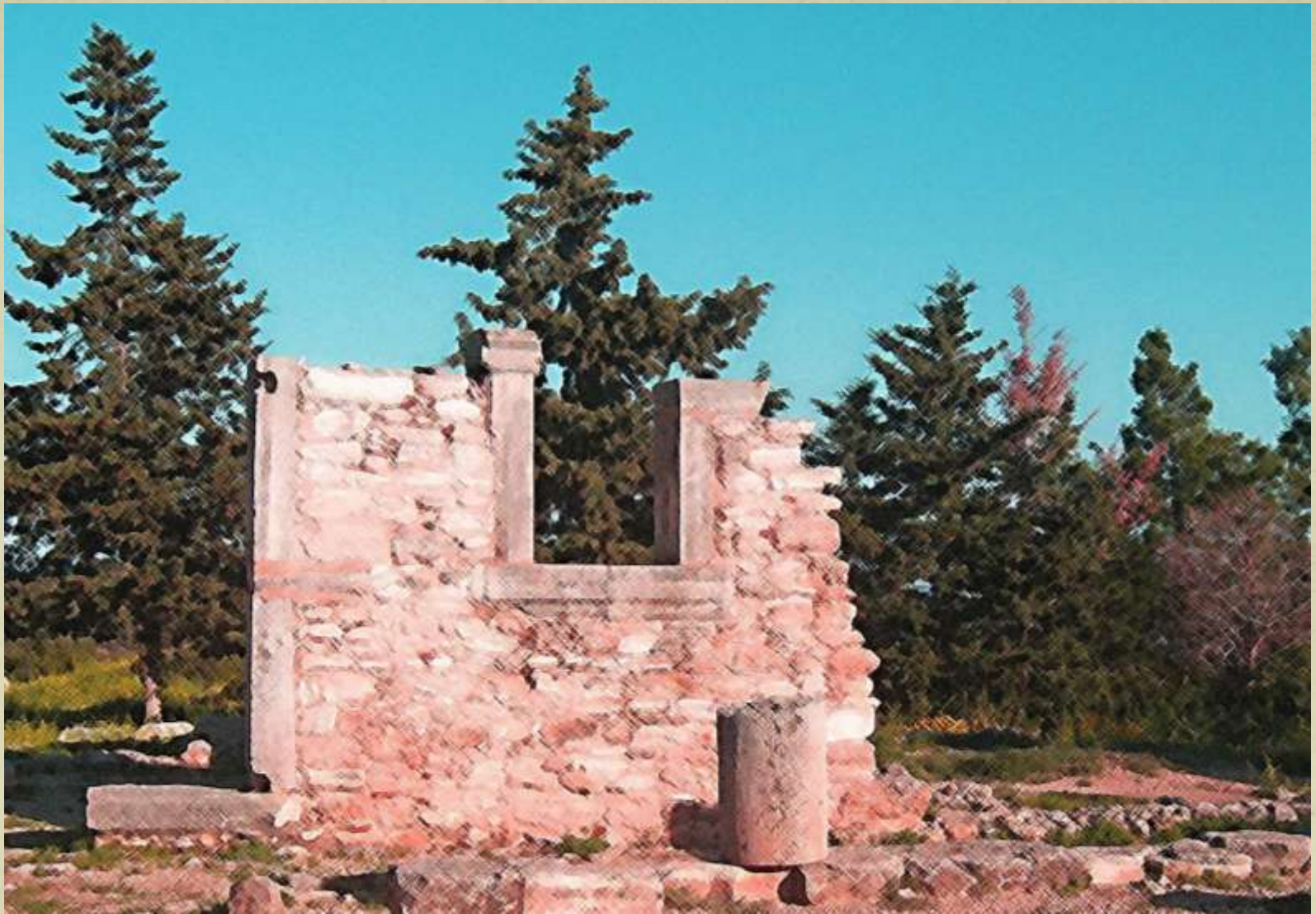
Apollo la fereastră, Cipru