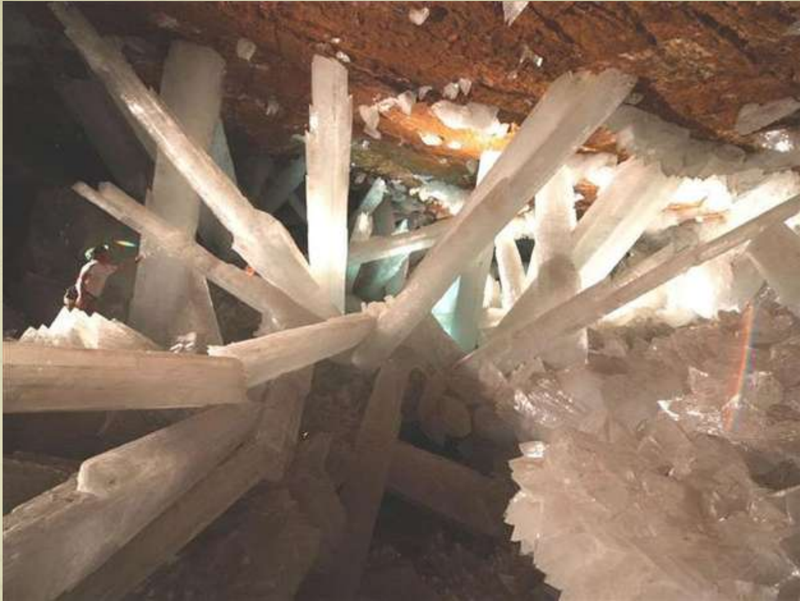
Fracturi (în Mina Nica, Chihuahua, Mexic )