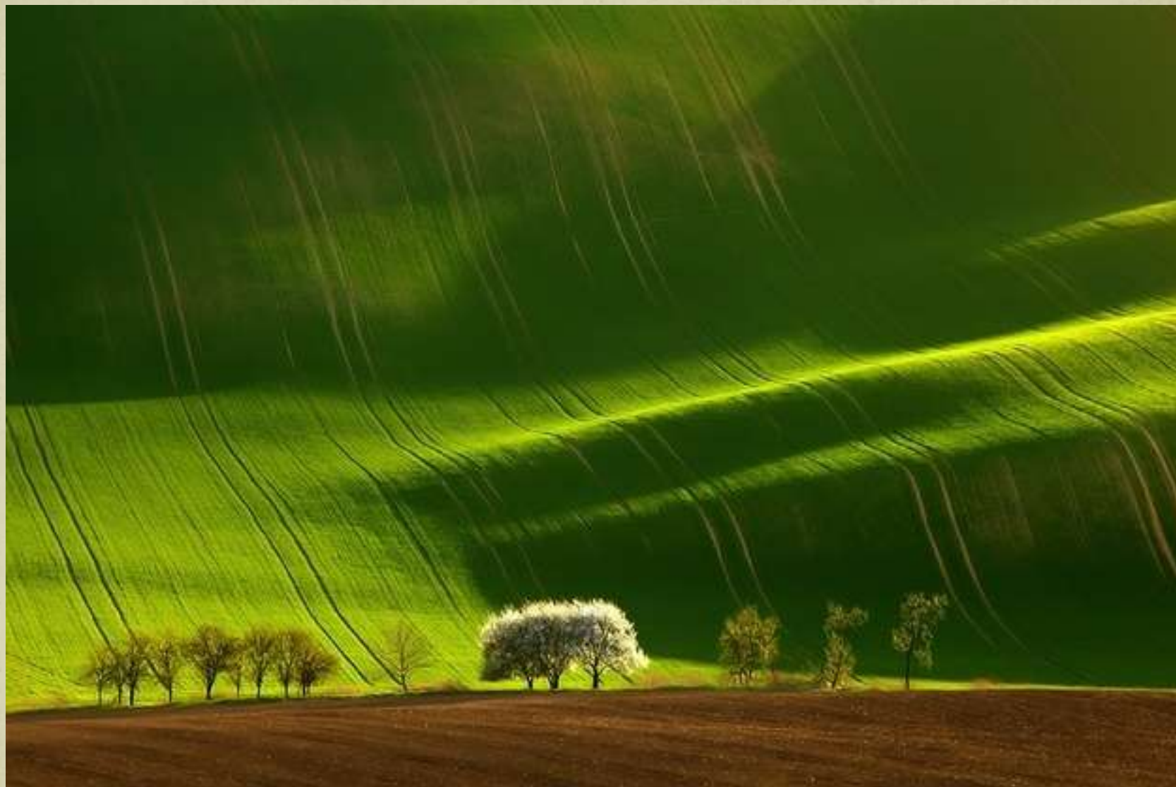
Câmpuri în Moravia, Cehia