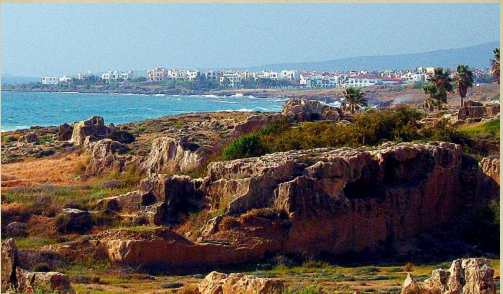
Ad nauseum, Pafos, Cipru