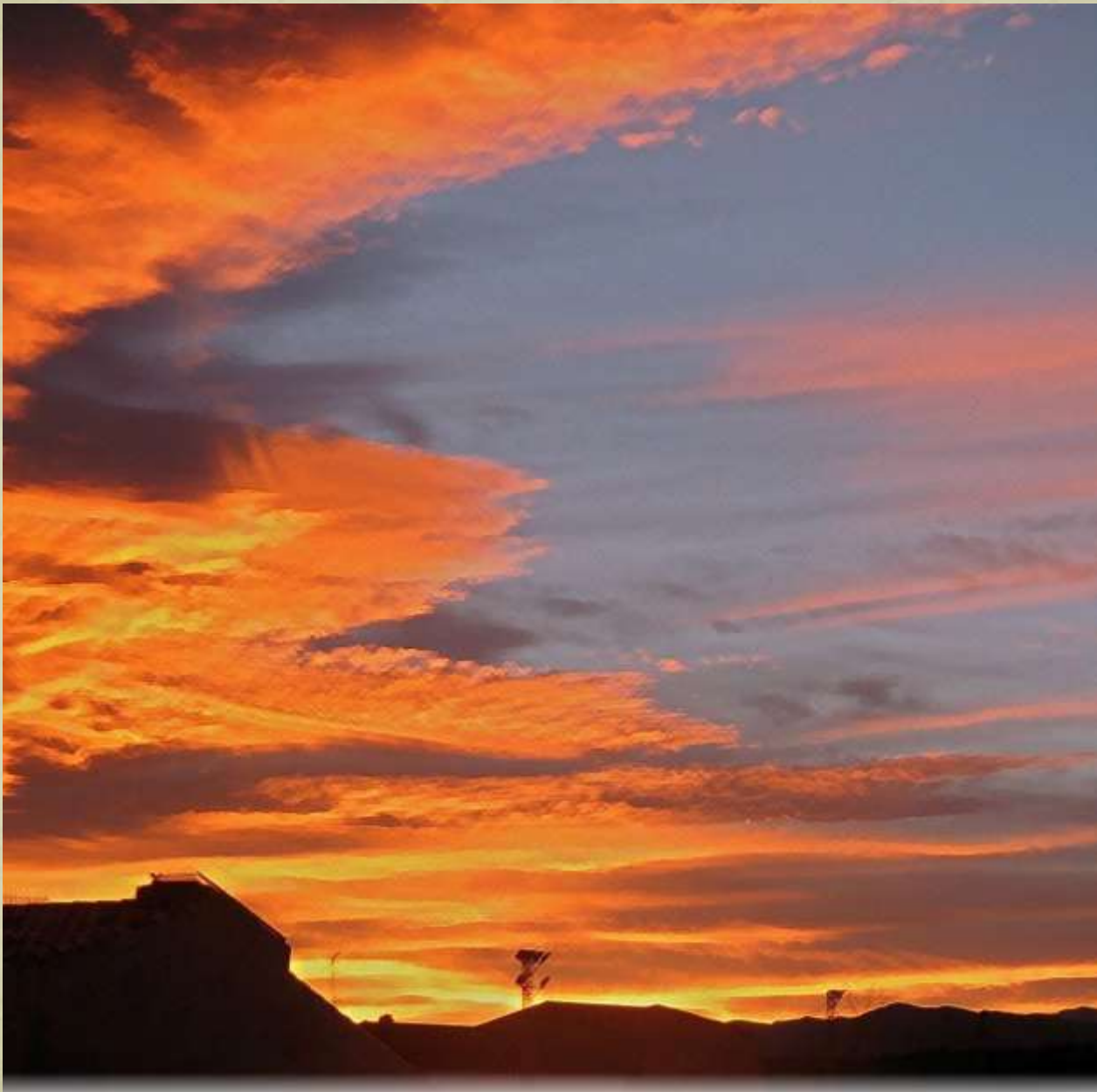
Apus de soare în La Jana, Spania