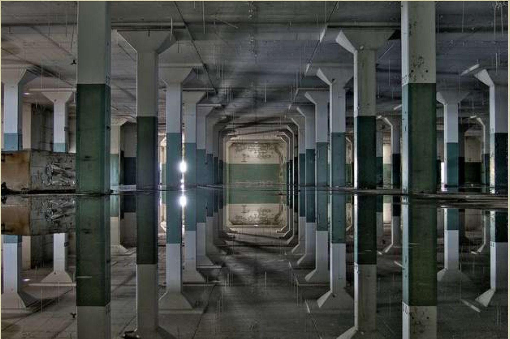
Disciplina rutinei (Mare Island Naval Shipyard, Vallejo, California, USA)