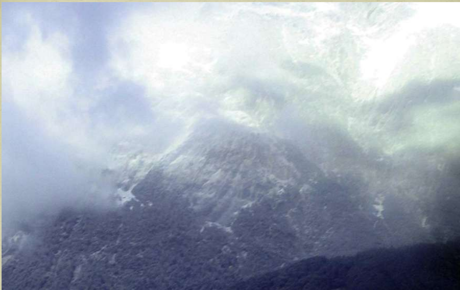
Făgărașii în ceață