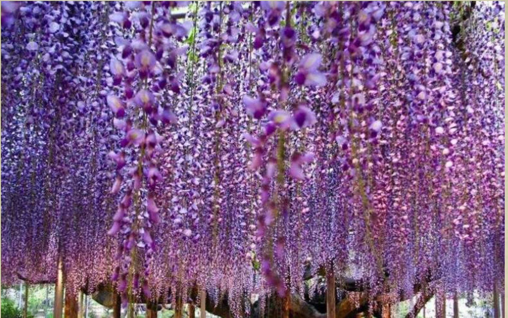
Gradinile Fuji, Japonia