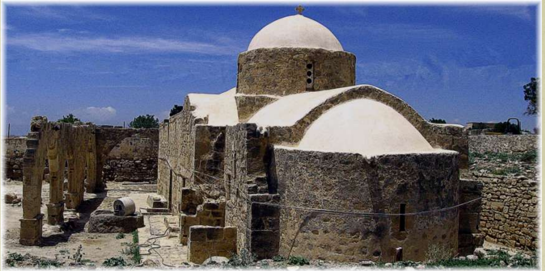
Timpuri. În Cipru