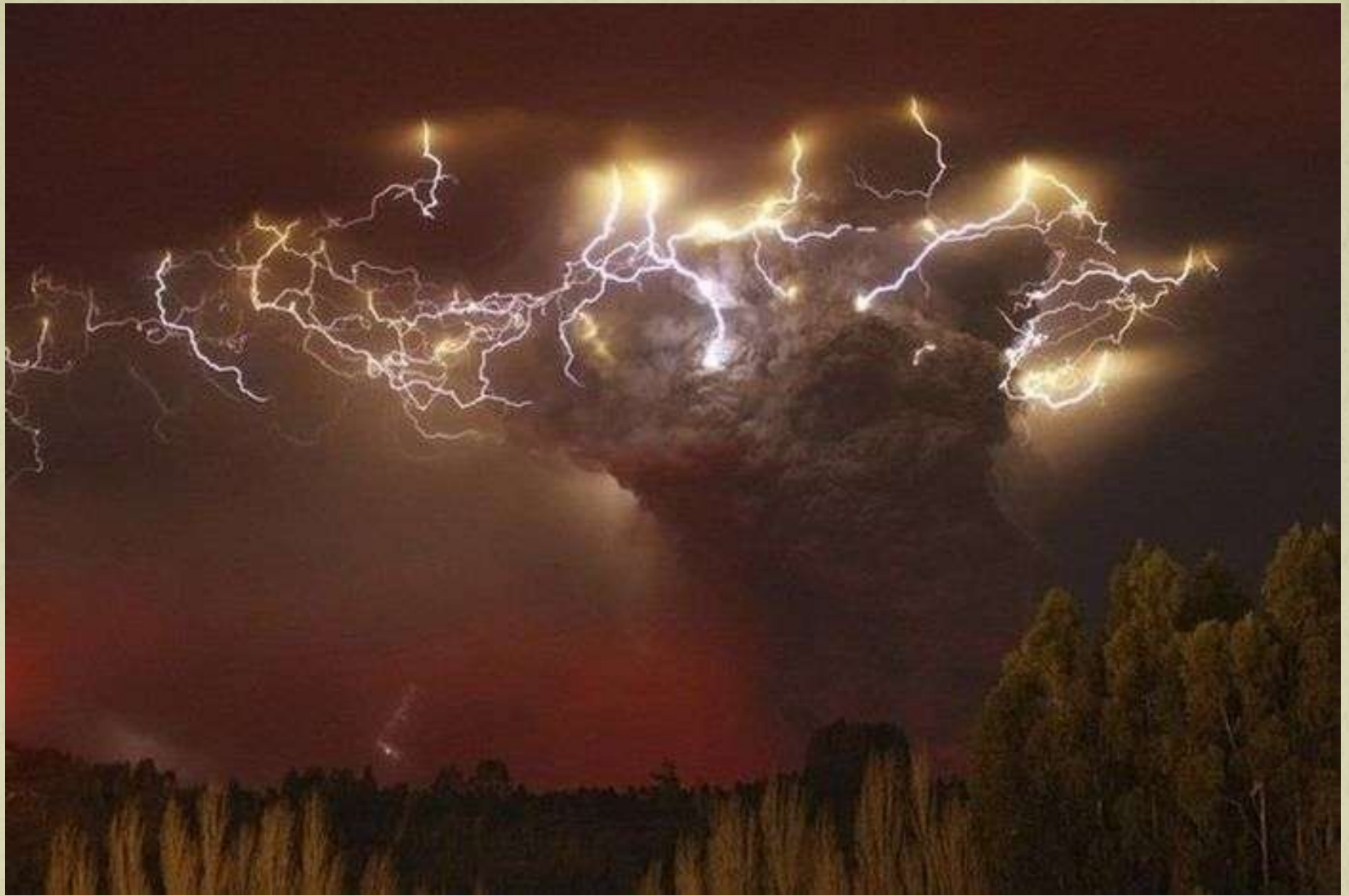
Timp electrizat ( pe cerul mexican )