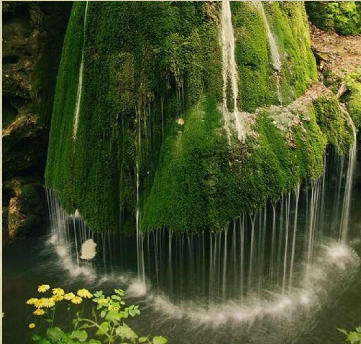
Urcarea în jos: Cascada Bigăr, Caraș-Severin, România