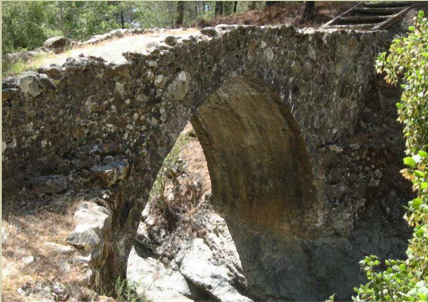
Pod venețian, Cipru