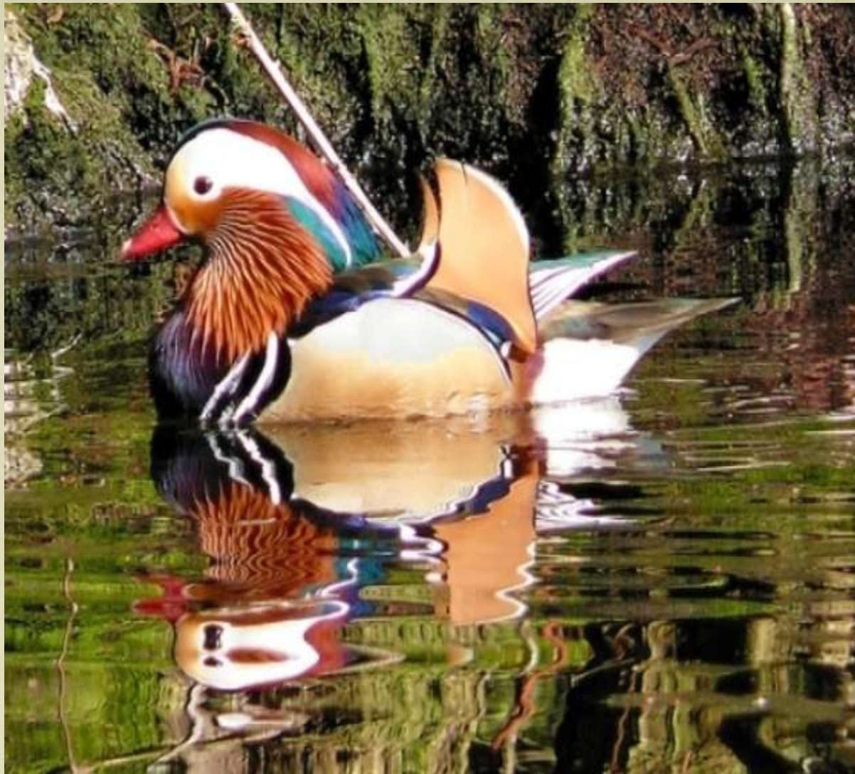
Culori în oglindă (pasărea Mandarin)