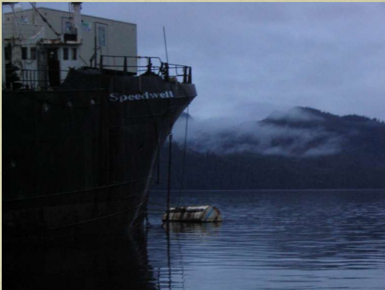
Barjă în Alaska, SUA