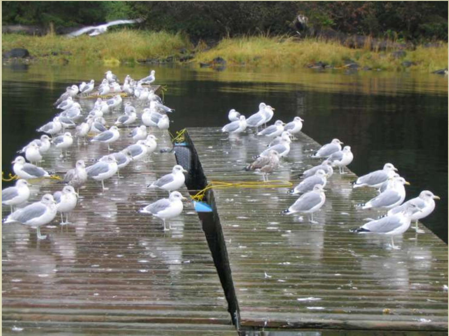
Şedință de păsări