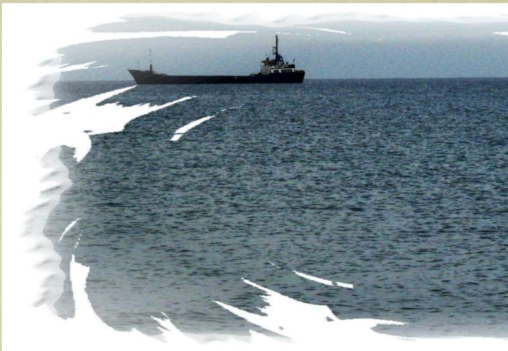
Vapor în larg