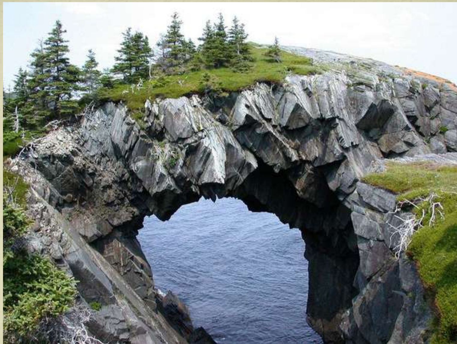
Podul cu gânduri: Berry Head Arch, Newfoundland, Canada