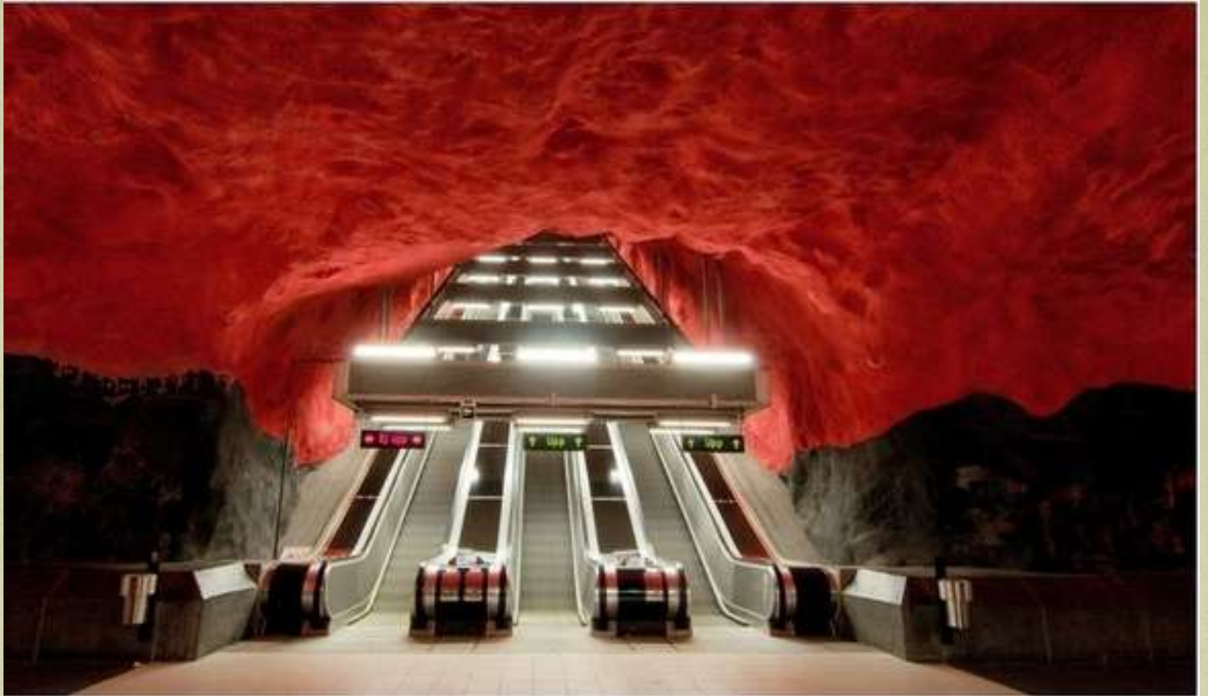
Gură de metrou din Stockholm, Suedia