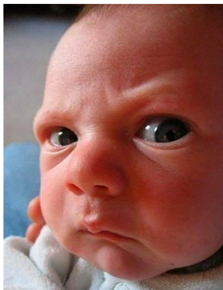
Și, în fine, zâmbet românesc