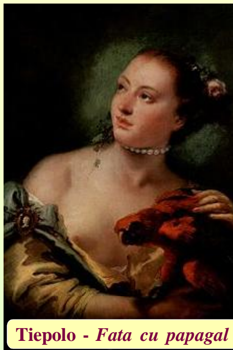
Tiepolo - Fata cu papagal

După lectura cărții ai un sentiment ciudat