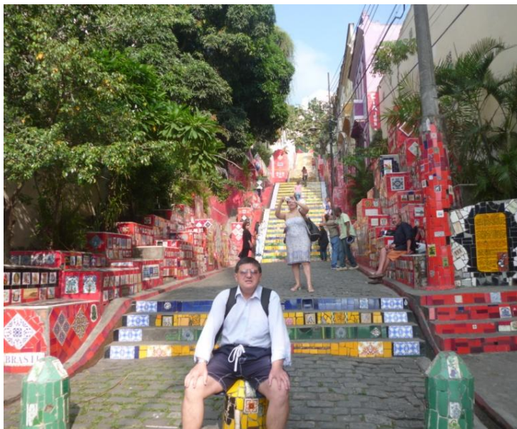
Autorul, pe scările Selarón