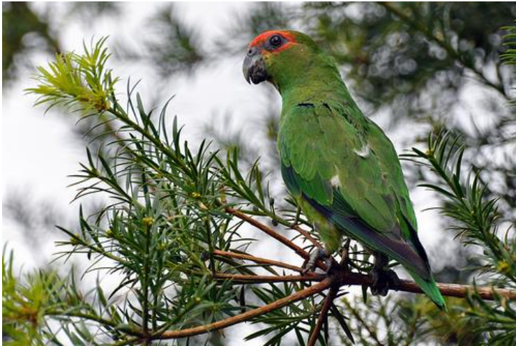
Cuiú-cuiú în Parque das Aves