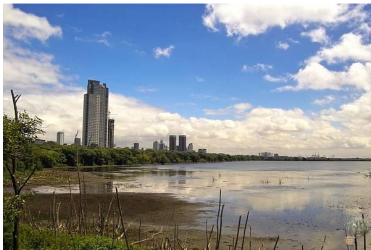
Laguna de los Patos, Buenos Aires

Din Amazonia în Pampas (fotojurnal instantaneu)