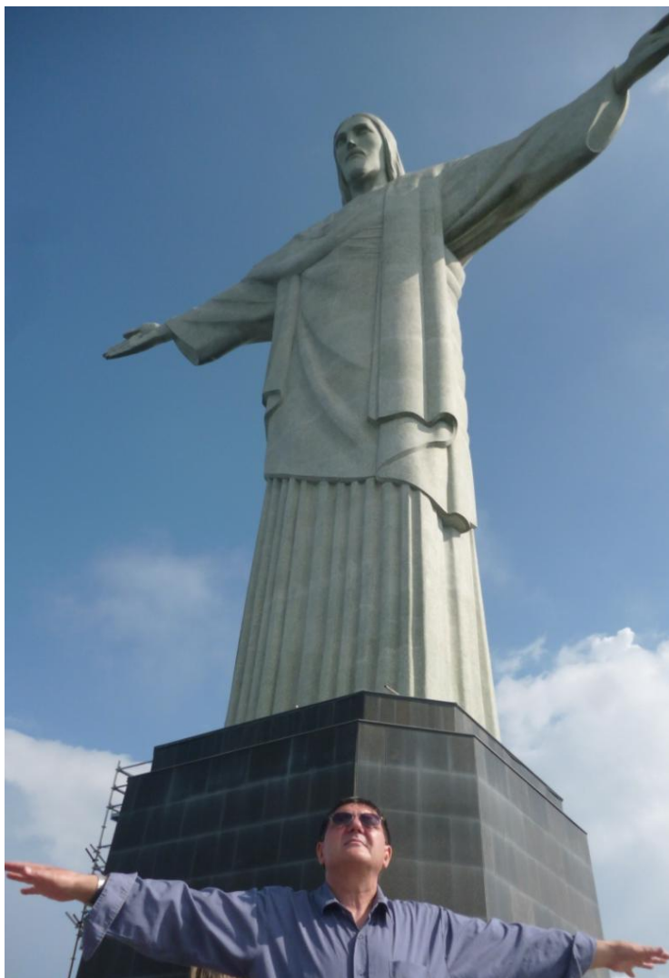
Statuia reprezentându-L pe Iisus Mântuitorul, în Rio de Janeiro

Din Amazonia în Pampas (fotojurnal instantaneu)