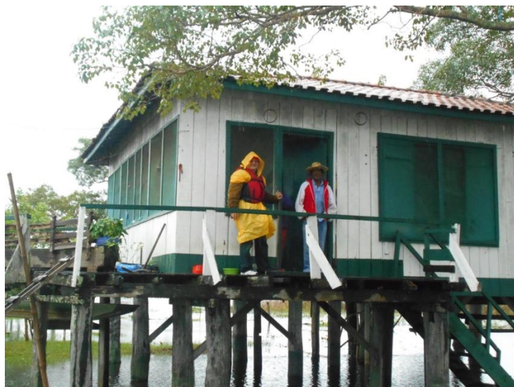
O casă flotantă ( flutuanta ipuxuna ) în Pantanal, Brazilia

După alte surse cercetate, am găsit date diferite.