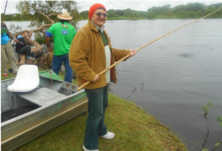
La pescuit în râul Miranda

Dar apa caldă și curentul ne ducea lin la vale. A fost fun ! Când să ies la mal, mă împingea curentul, depărtându-mă de debarcader.