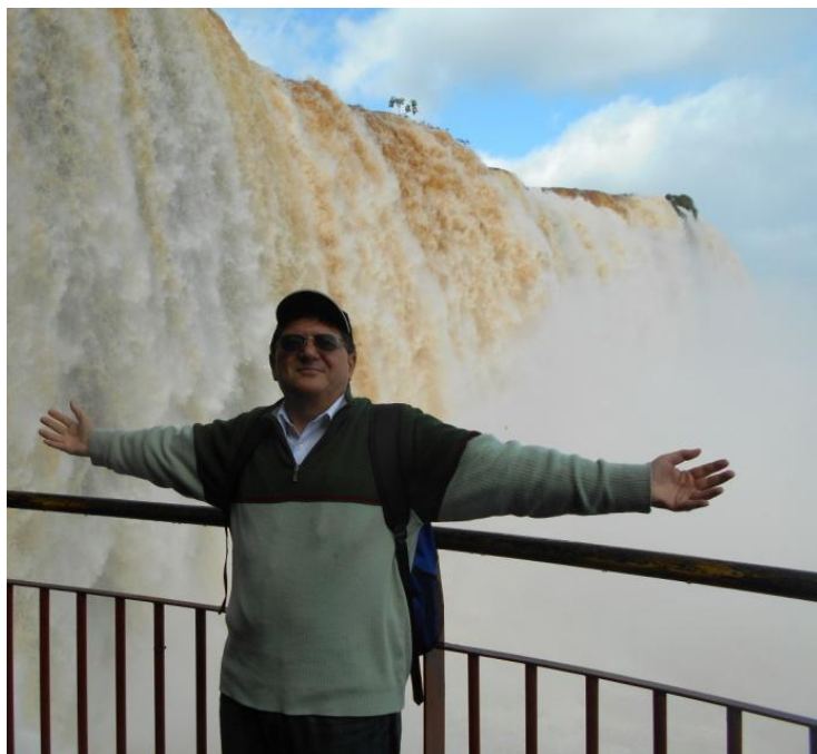
Autorul, la cascada Iguassu

Din Amazonia în Pampas (fotojurnal instantaneu)