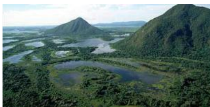
Panoramă din Pantanal

Cinci ore la drum întins spre vest, cu un singur stop la un restaurant cu autoservire în orașelul Miranda.