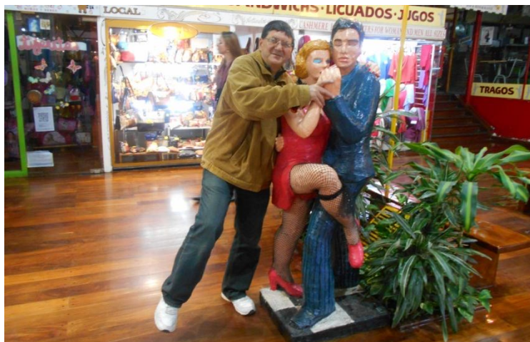
Buenos Aires, orașul tangoului

Dansuri pe stradă. ¡Que hermoso! Doar suntem în țara tangoului... Există și Academia Nacional del Tango, chiar lângă hotelul nostru, pe Avenida De Mayo.