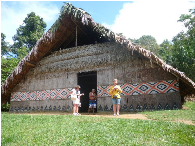
Casă în stilul Indigenilor Tokano în Amazonia, Brazilia

Trecem pe lângă un arhipelag de insule minuscule. Când nivelul râului scade, insulele ies mai mult la suprafață.