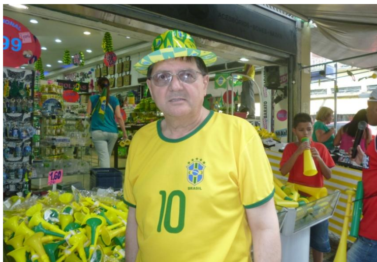
Autorul, vârf de atac al multiplei campioane mondiale, Brazilia (!)