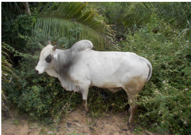
Vaca având cocoșă în pámpa

Am văzut o pasăre înaltă (120 cm) cu gâtul și capul negru, corpul alb, iar lungimea ei cu aripile întinse atingând 110 cm, numită în portugheză tuiuíú , iar în engleză jabiru stork (specie de cocostârc); această pasăre este un bun pescar; de asemenea, prinde și șerpi.