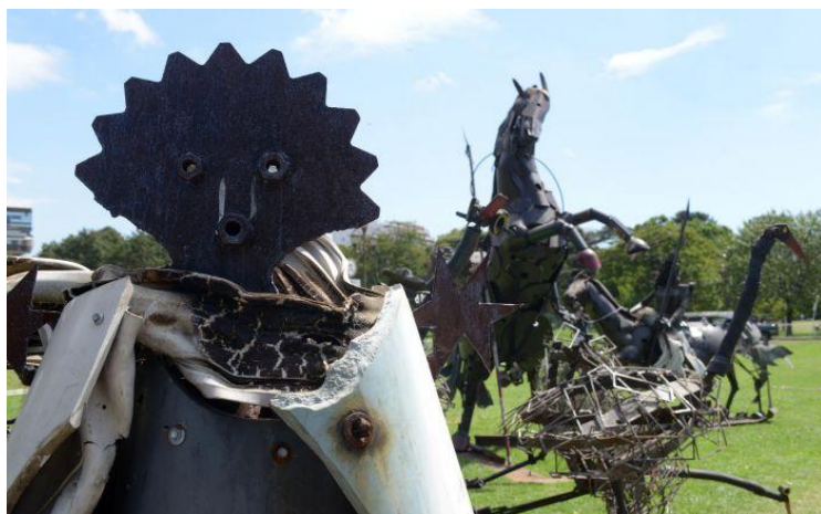
Artă «metalică» de Carlos Regazzoni

Un memorial adus lui Raoul Gustaf Wallenberg (n. 1912 – ?), eroul fără mormânt, dispărut în acțiune în Cel de-al Doilea Război Mondial.