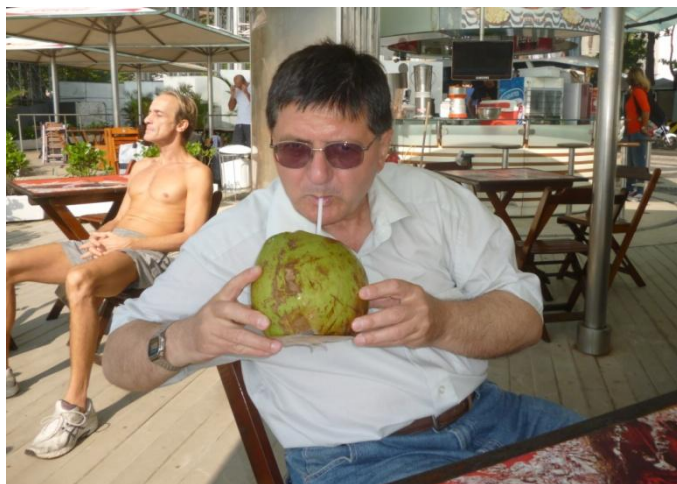
Autorul, consumând suc de cocos

Etimologic, cuvântul Pantanal vine de la cuvântul portughez pântano , care înseamnă teren ud, mocirlă. Sezonal, regiunea este inundată, apoi desecată.