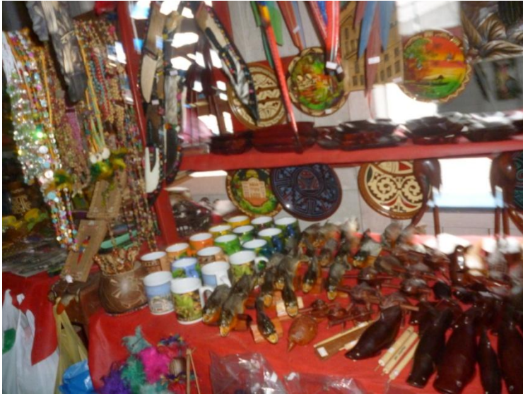
Artă artizanală braziliană

Un stand de cărți în portugheză, spaniolă și engleză. O sărbătoare relaxantă, mai ales că dimineața e răcoare și umbră, dorite atât de mult sub torida tropicală.