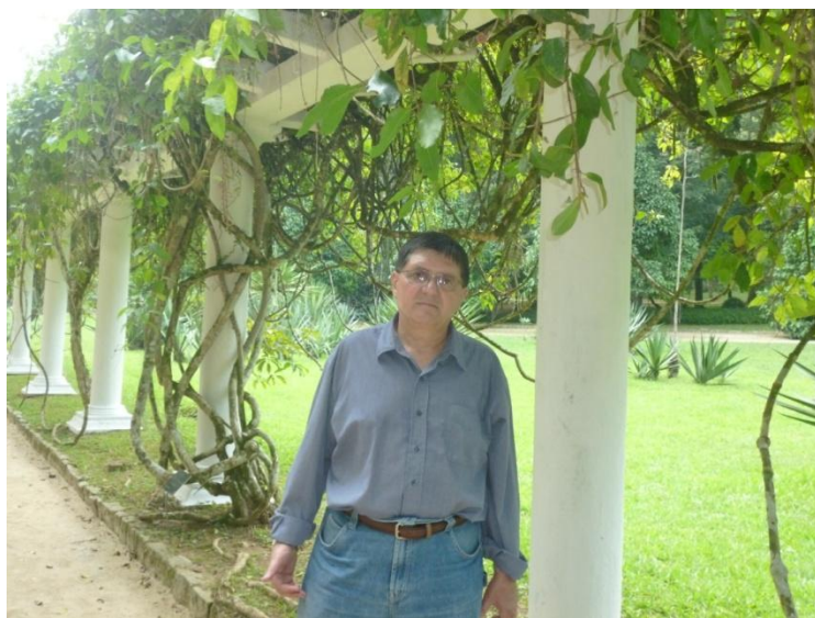
Autorul, în Jardim Botânico (Grădina botanică) din Rio de Janeiro

Există multe parcuri în Rio, dintre care: Parque [Parcul] do Flamengo, da Cidade, Penhasco Dois Armãos, da Maropendi, Bosque da Barra, da Prainha, Chico Mendes, Sítio Barle Marx, da Catacumba, da Tijuca, Parque Lage, dar am preferat Grădina Botanică.