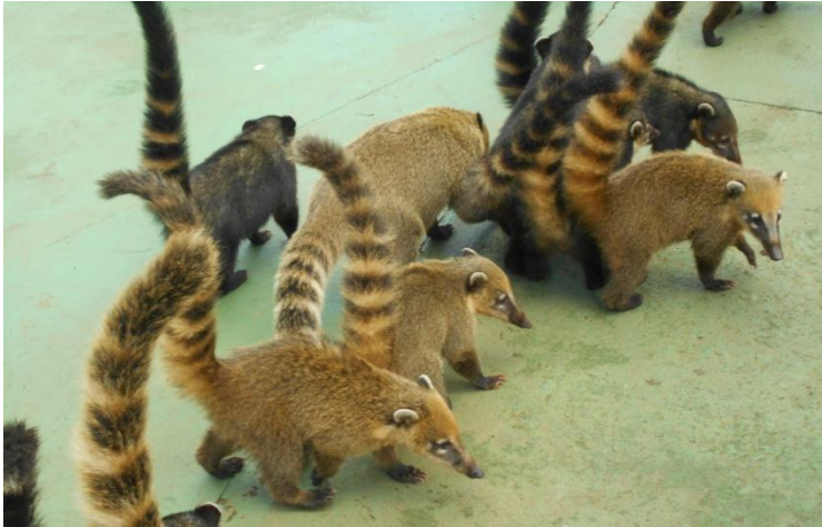
Animalele quati , în Iguazu.

Se numește quati și s-a obișnuit cu oamenii. S-au strâns o turmă. Ne miroase și caută mâncare și chiar își vâră botul în buzunare sau sacoșe.