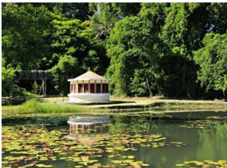
Imagine din Jardim Botânico

Jardim Japonês (Grădina japoneză) a fost creată în 1835 în urma aducerii la Rio a 65 de specii de plante nipone.