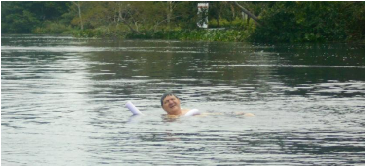
O baie în râul Miranda

25.05.2014 – Dormit în hotelul Lotra Pantanal de pe malul râului. Micul dejun între 6 și 8 dimineața.