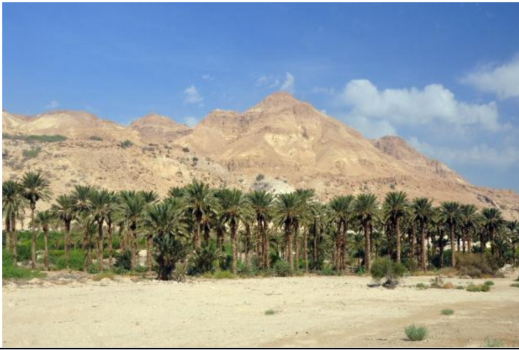
Pepinieră de palmieri

Naipi a fost pedepsită să rămână o stâncă, bătută de apele ce cad în locul denumit Beregata Diavolului, din cadrul cascadelor Iguaçu, iar Tarobá a fost transformat într-un palmier, care să o contempleze pe Naipi .