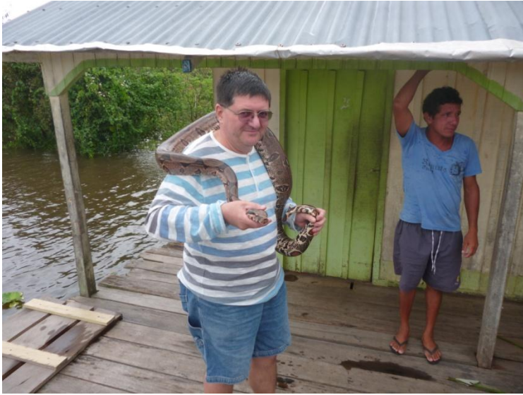
Autorul, cu o cobra giboia după gât

Jungla este puțin populată, iar între așezările ome-nești nu sunt șosele. Se circulă pe canale de apă sau cu avionul.