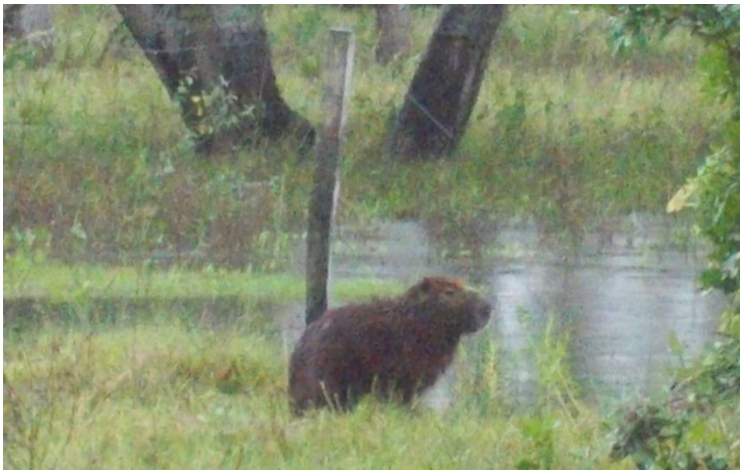
Un exemplar de capibara

Deși am avut o pelerină galbenă, adusă din New Mexico, m-a udat ciuciulete ploaia continuă. N-am niciun pantalon de schimb, niciun pulover de schimb.