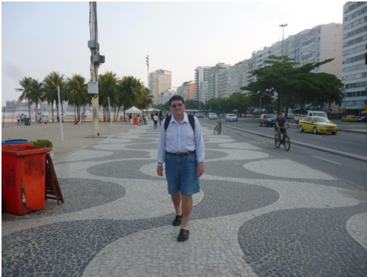
Copacabana, Rio de Janeiro

Cu autobuzul 502 mergem în Copacabana, cartier al orașului Rio de Janeiro, cu o celebră plajă plină de lume și o faleză splendidă.