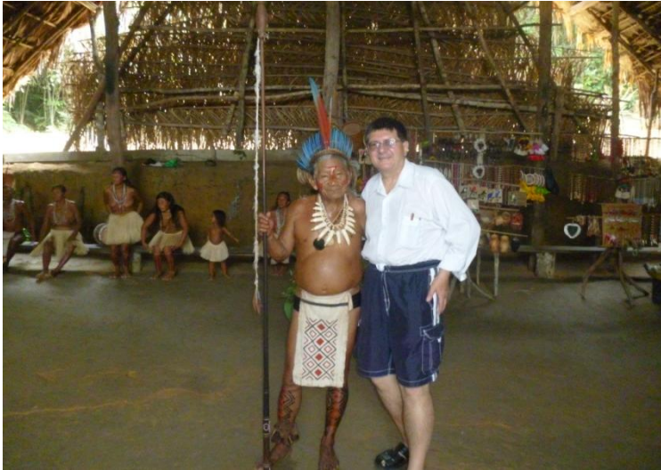
Autorul, cu Șeful tribului Tokano

Valurile sunt roșii la mal. Mai mult exotic, decât frumos. Mai mult interesant, decât incitant.