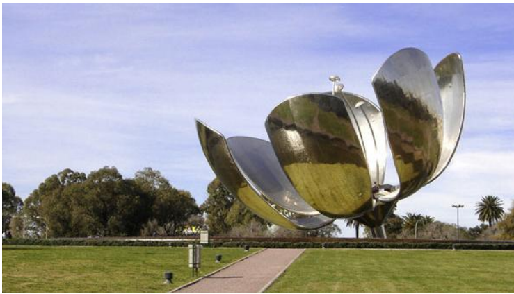
Floarea de aluminiu a lui Eduardo Catalano

Plaza de Las Naciones Unidas . Se întinde pe patru hectare. La mijloc, «La Flor», monument emblematic ridicat de arhitectul Eduardo Catalano.