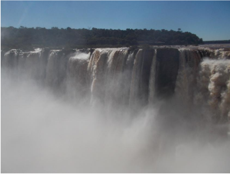
Cascada Iguassu, Argentina

La vama argentiniană, cu pașapoarte americane, nu ne trebuie viză de intrare, ci cuponul de taxă de reciprocitate (pe care-o plătisem pe internet) și care-i valabilă 10 ani de la data cumpărării (24.03.2014) pentru multiple intrări.