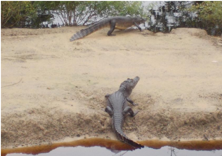
Caimani în Pantanal

caimanii sunt vânați pentru pielea lor și pentru carne, dar, de când au fost ocrotiți de lege, s-au înmulțit prea mult; în portugheză, se numesc jacaré ; caimanii nu atacă deloc oamenii, în schimb sunt mâncați de peștii piranha , care, deși mult mai mici, atacă în grup;