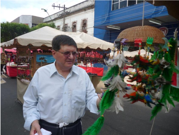
Bâlciul duminical din Manaus

Campionatul Mondial de Fotbal 2014 se va ține în Brazilia, care-a câștigat până acum de cinci ori Campionatul Mondial.