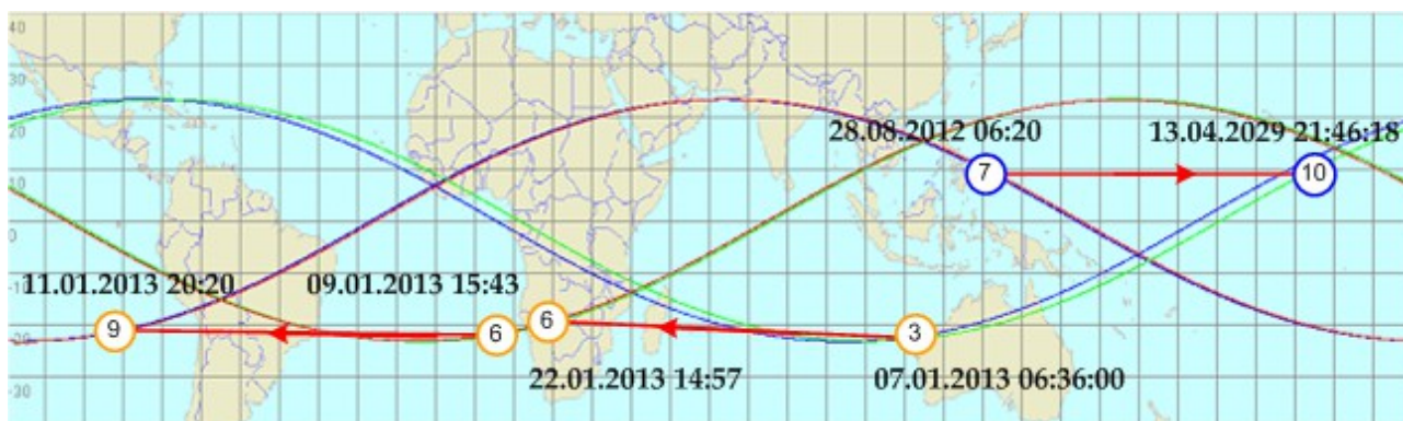
Рис 1: Карта проекций эклиптики и Солнца на поверхность Земли для сновидений и событий. Переходы пар сновидение-событие и событие-событие.

Структура нооматерии может быть выявлена путем анализа ее внешних проявлений. Возможно, что существует множество способов получить эти проявления, но здесь ограничимся лишь феноменом сновидений, полагая, что эта данная природой возможность и служит для реализации основных принципов нооматерии. В сообщении [9] рассматривается отображение кластера событий и сновидений ( Рис.1 ) на кубооктаэдр.