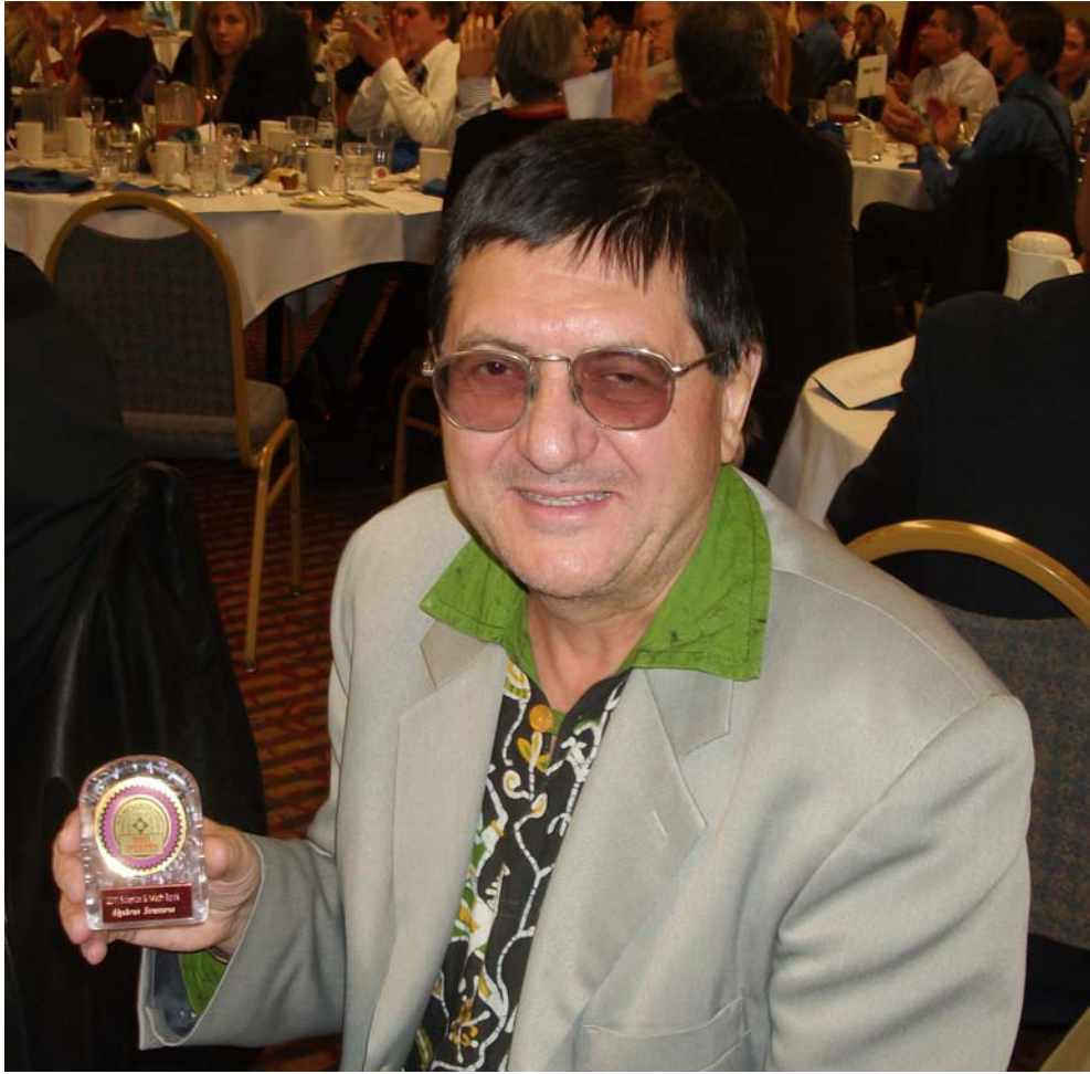
Profesorul român primind medalia pentru structuri algebrice. Profesoara indiană nu a putut veni.

Fiecare carte este recenzată de cel puțin 3 critici, iar la egalitate de puncte numărul recenzițiilor este mărit la 6-9 persoane.