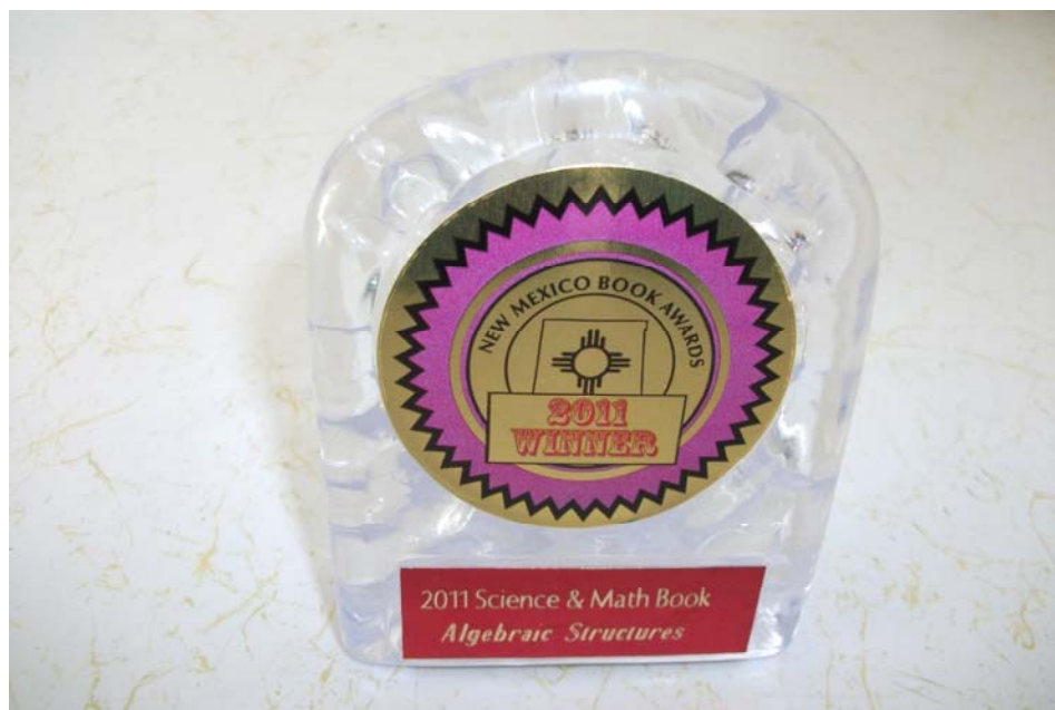
Medalia de câștigător la secțiunea Știință și Matematică

După o primă selecție au fost anunțați în luna septembrie finaliștii, iar pe 18 noiembrie a fost gala laureaților în incinta Hotelului Elegante din Albuquerque, la care au asistat circa 160 de persoane.